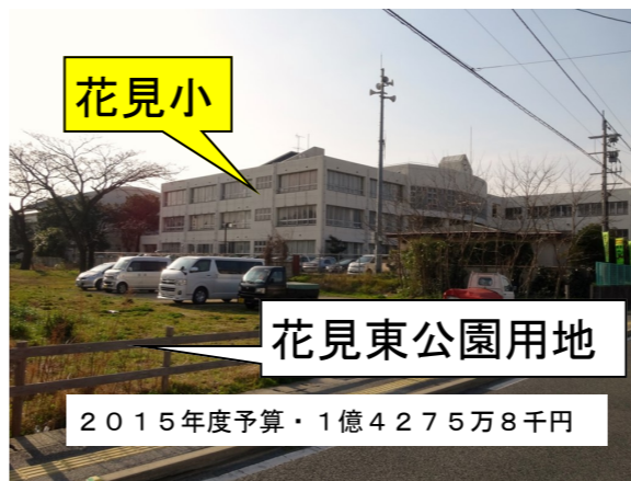
ワークショップを踏まえ2016年3月完成予定