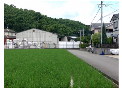
適切な規制必要な田園居住地区

全域都市計画区域への編入を延期したもとの、乱開発を防止し、住環境や農業環境を守るために必要な条例であると判断します。今後、竹下市長自ら地域に出かけ説明する予定です。