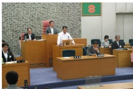
議会基本条例特別委員会の最終報告(6月6日)