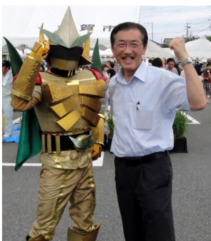
古賀のニューヒーロー (軽トラ市で・7月7日)