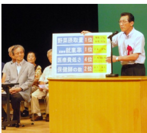
老人会教養講座開会式でフリップを使って挨拶 (7月10日)