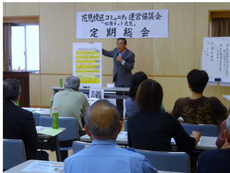
パネルを活用して挨拶(校区コミュニティ総会)