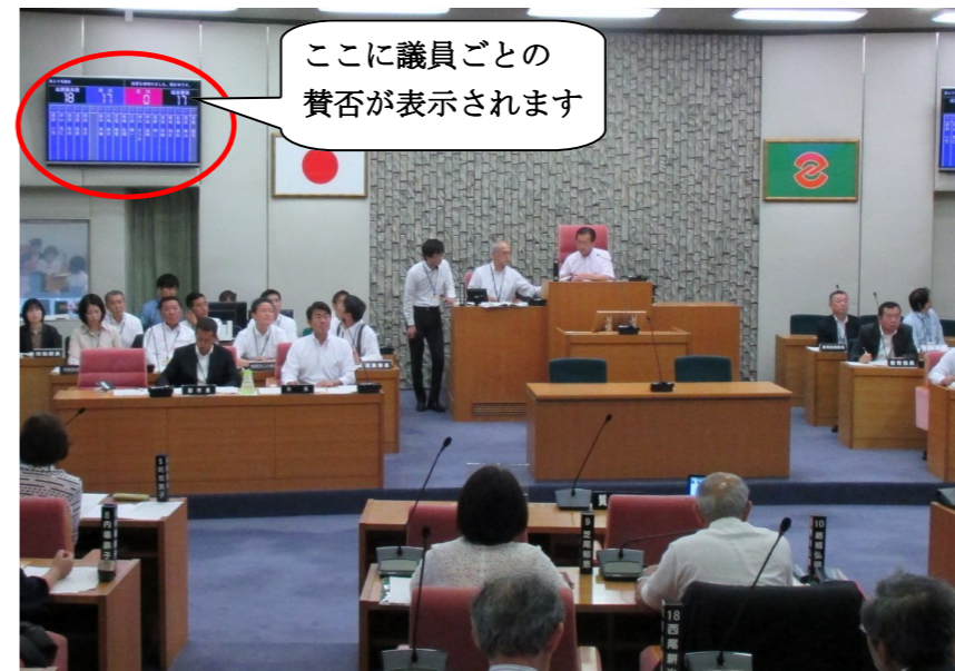
ここに議員ごとの賛否が表示されます