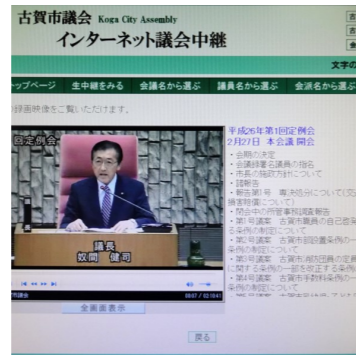
動画で見れる議会の様子