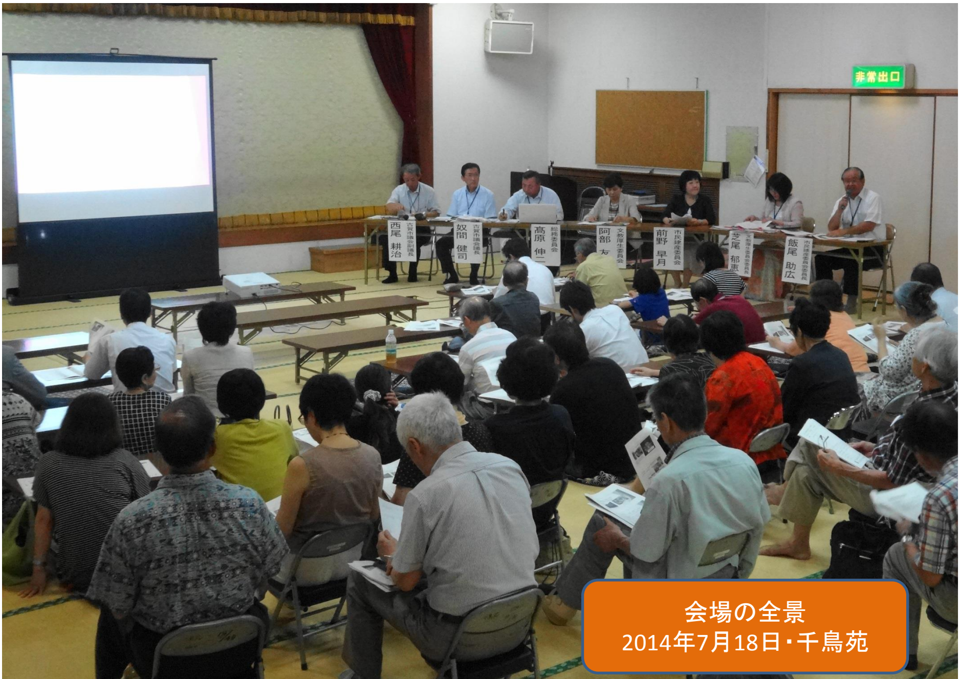
会場の全景 2014年7月18日・千鳥苑