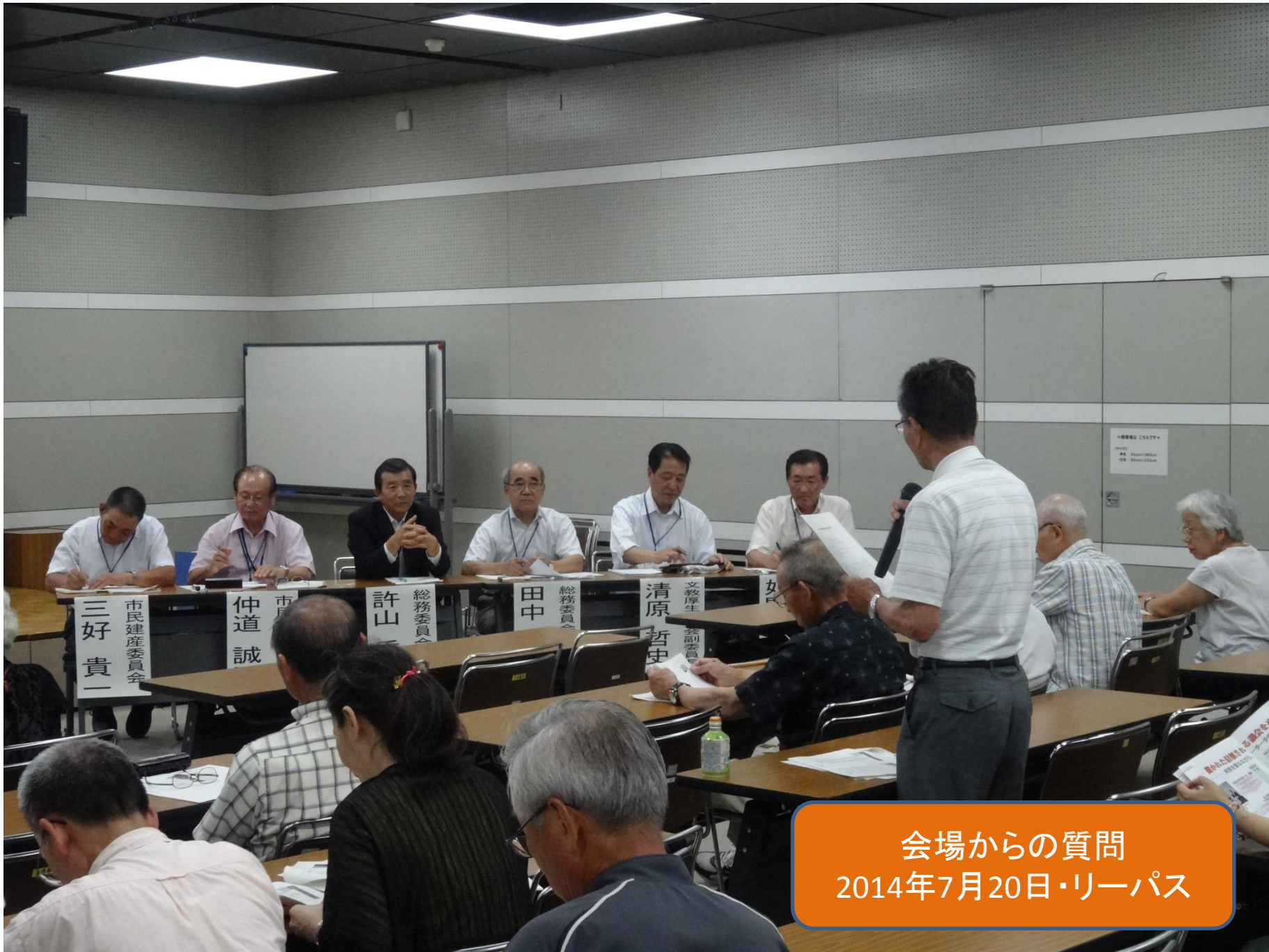
会場からの質問 2014年7月20日・リーパス