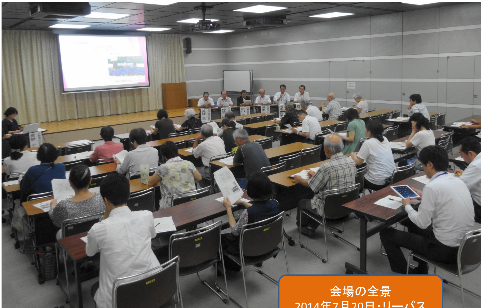
会場の全景 2014年7月20日・リーパス