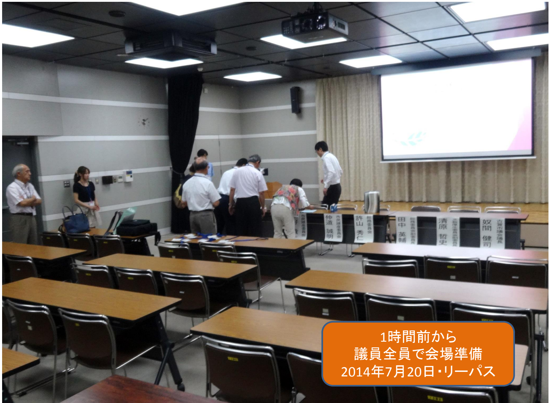
1時間前から 議員全員で会場準備 2014年7月20日・リーパス