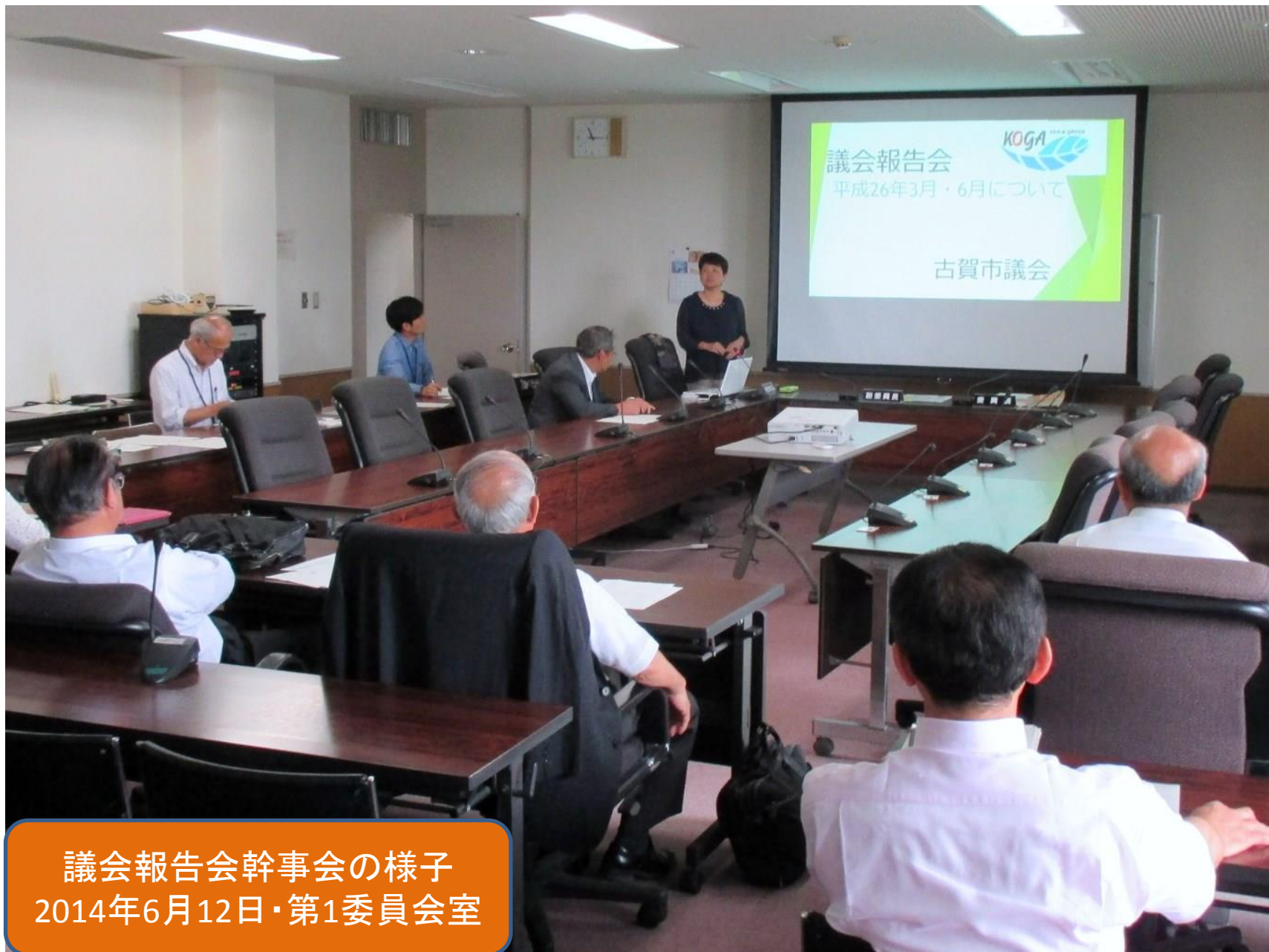
議会報告会幹事会の様子 2014年6月12日・第1委員会室