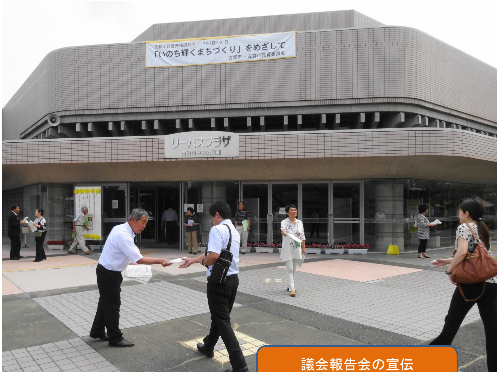
議会報告会の宣伝 2014年7月5日・リーパス