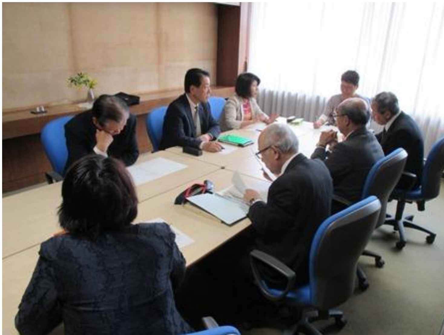
議会報告会幹事会 (4月18日の会派代表者会議の合意を経て開催) 2014年4月30日・議会応接室