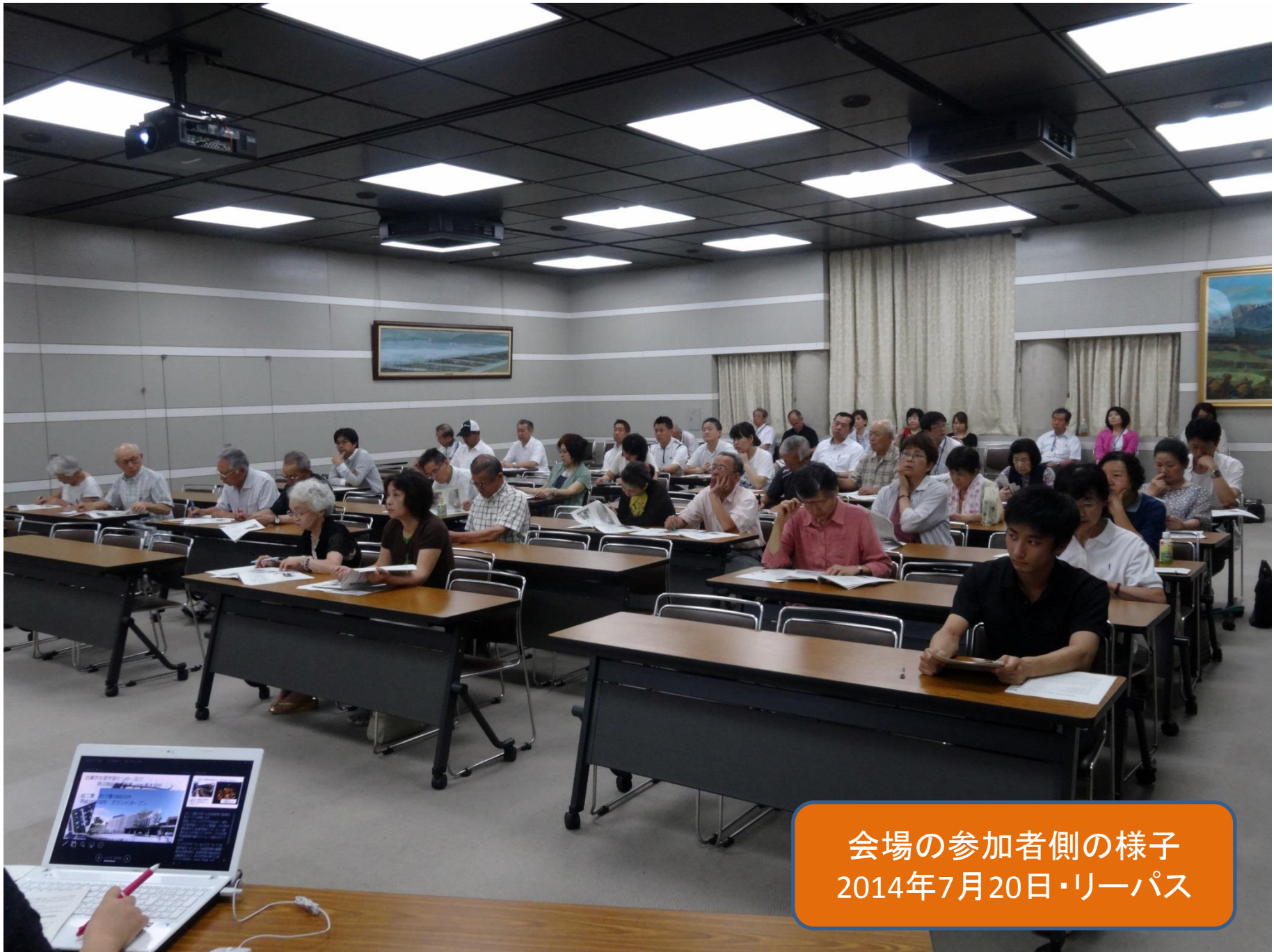
会場の参加者側の様子 2014年7月20日・リーパス