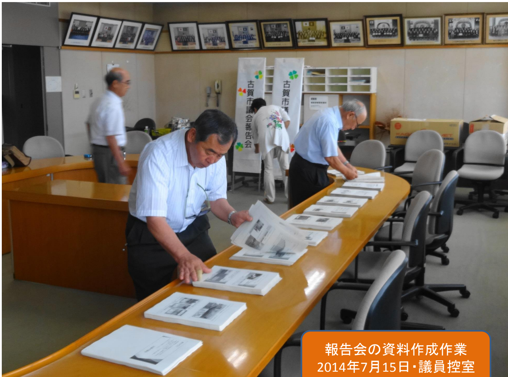
報告会の資料作成作業 2014年7月15日・議員控室