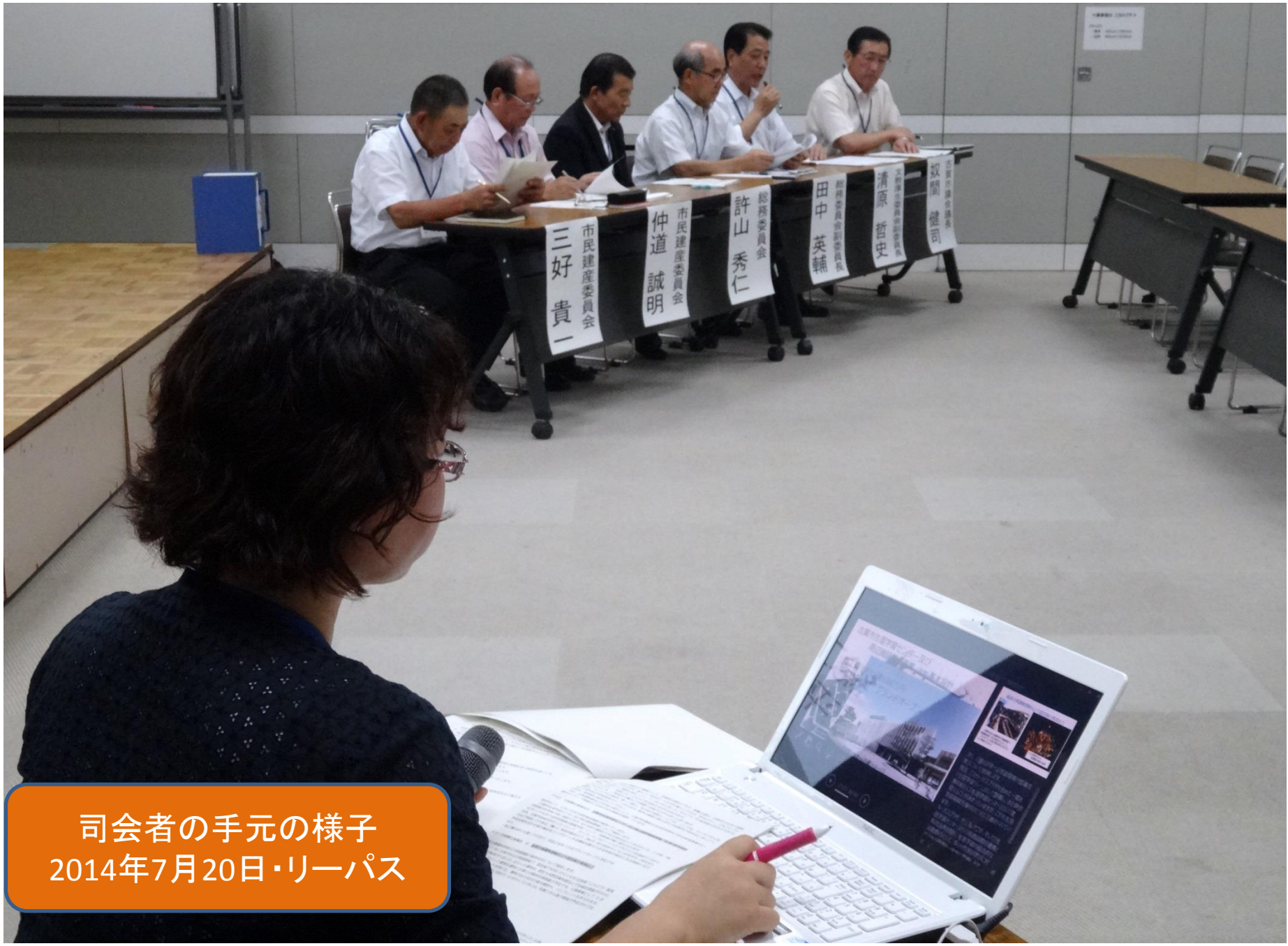
司会者の手元の様子 2014年7月20日・リーパス