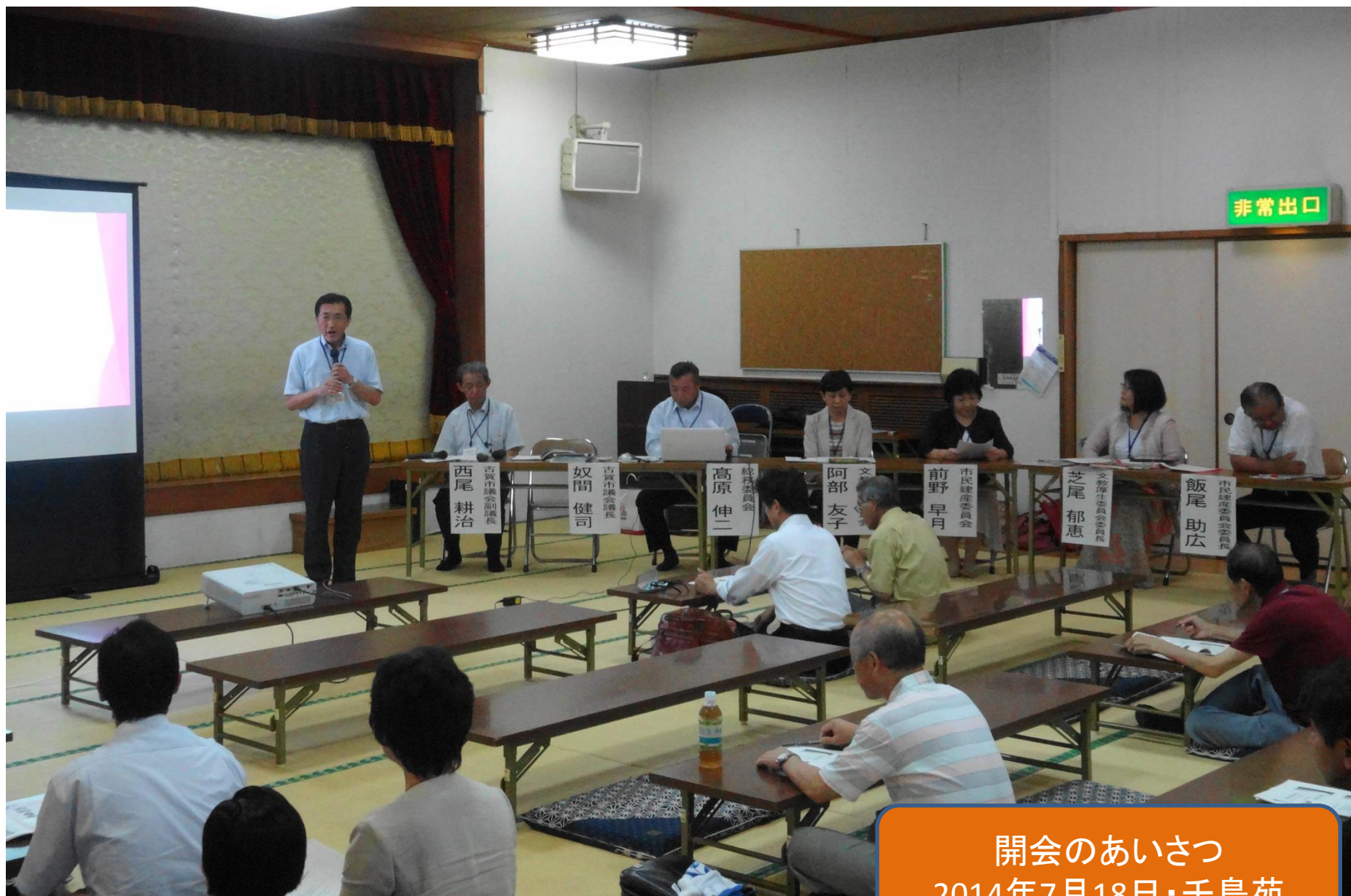
開会のあいさつ 2014年7月18日・千鳥苑