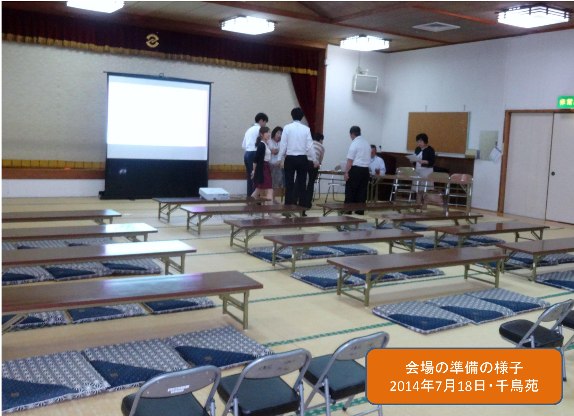
会場の準備の様子 2014年7月18日・千鳥苑